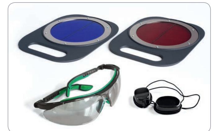
Filtry, brýle pro terapeuta, brýle pro pacienta