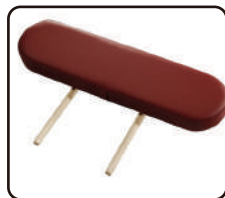
Bočné opierky rúk - 2x (iba stoly UNO)