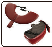
Predné operadlo (iba stoly Oval)